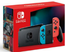
Nintendo Switchのロゴ・Nintendo Switchは任天堂の商標です。